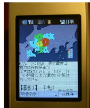
図-3 地上デジタルテレビ放送による「震源・震度に関する情報」のデータ放送例(TBS 天野教義氏より)