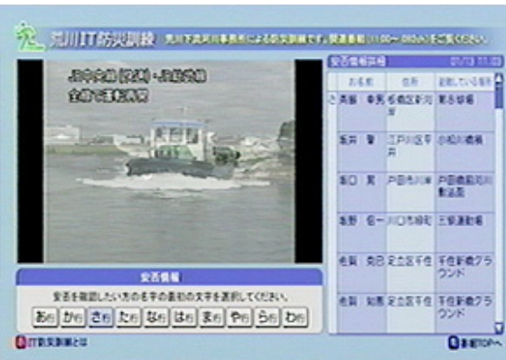
図-5 荒川下流河川事務所の IT 防災訓練画面例 上:自治体被災情報、下:住民安否情報(ホームページより)

最後に、ご指導頂いた藤吉洋一郎先生をはじめ、本研究にご協力頂いた皆様に深謝申し上げます。