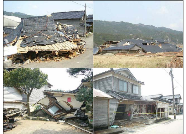
図-1 平成19年能登半島地震による輪島市門前町の被害

また、緊急放送送出時に待機から受信状態に移行させる「緊急警報放送(EWS)」は、仕様として予め用意されているが、電源や起動に要する時間等の問題からうまく実用化されていない。